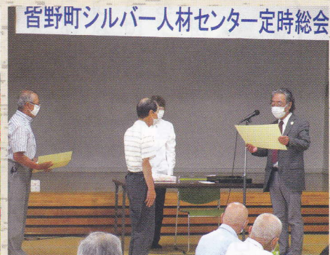
令和5年6月 定時総会