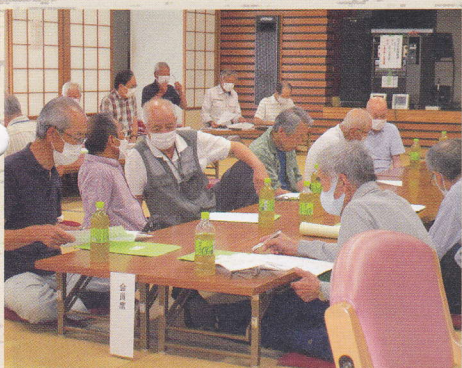
令和5年6月 親睦会総会