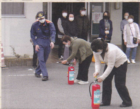
令和5年4月 長生荘消防訓練