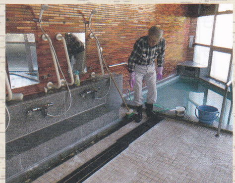
令和5年12月 長生荘ボランティア清掃