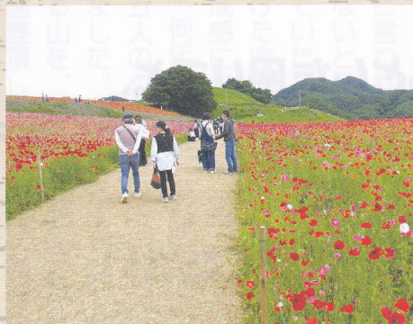
令和5年5月 高原牧場ポピーまつり