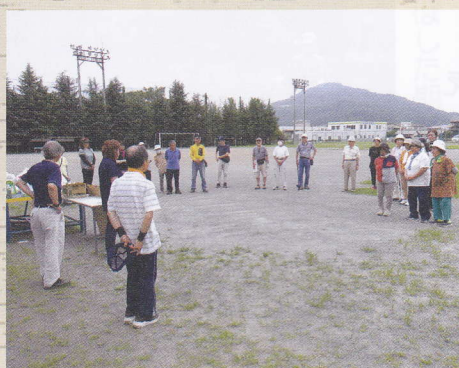
令和5年7月 グラウンドゴルフ大会