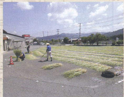
令和5年8月 正月飾り用藁天日干し