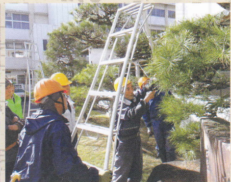
令和5年11月 植木剪定安全講習会

6年度に入り親睦会旅行が5年ぶりに日帰り旅行として実施されました。参加者は従来より少ない目でしたが、会員の親睦が図れ、有意義なひと時となりました。センターでは、健康で働く意欲のある会員を募集しています。お気軽に事務局までお声掛けください。