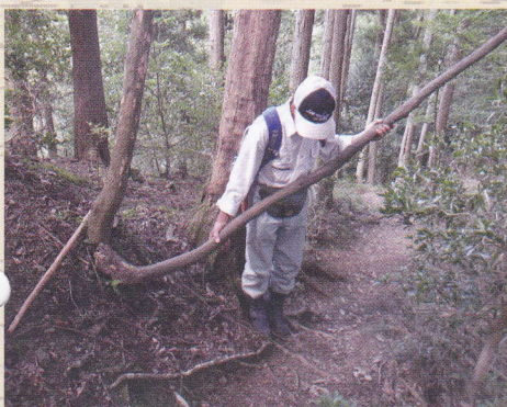
令和5年9月 関東ふれあい道整備